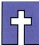
In die Ewigkeit abgerufen wurden

HERR, unser Gott, fülle uns frühe mit deiner Gnade, so wollen wir rühmen und fröhlich sein unser Leben lang.