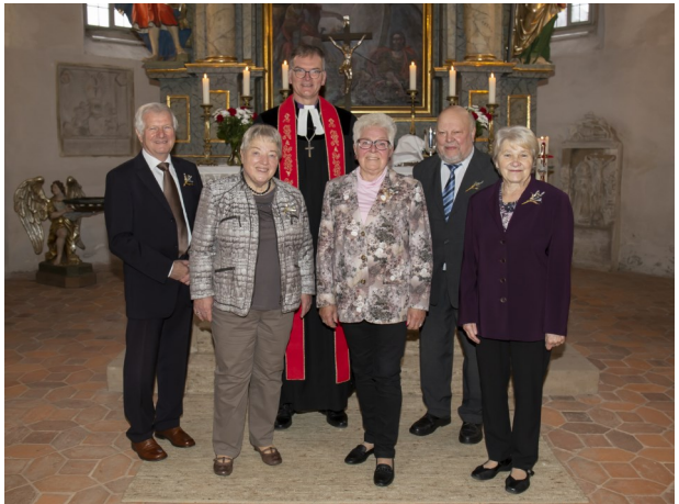
Die Diamantene Konfirmanden

Aberundet wurde die feierliche Stimmung durch gesangliche Beiträge des Kirchenchores.